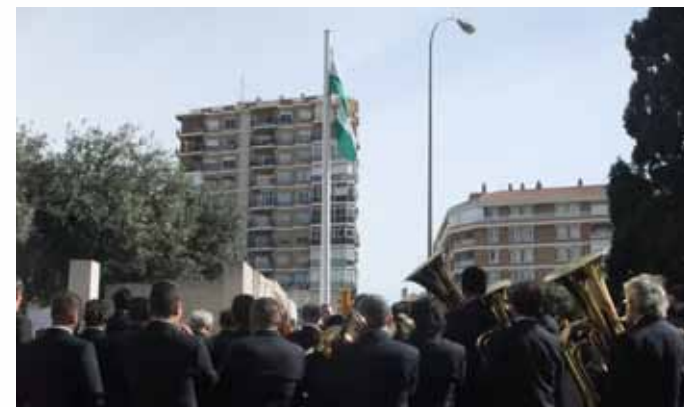
Intervención de la Banda en el día de Andalucía de 2014

INTERVENCIÓN EN EL ACTO OFICIAL CONMEMORATIVO DEL DÍA DE ANDALUCÍA