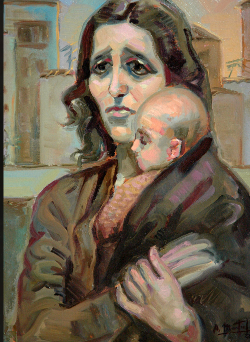
Maternidad en la pobreza, 1983