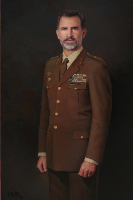
Retrato del Rey Felipe VI, 2019